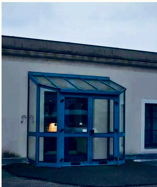
ACCÈS À UN PARKING À L'ENTRÉE DU CCAS

5 RUE HAUTE SAINT MARTIN 72300 SABLÉ-SUR-SARTHE. seniorsetautonomie@sablesursarthe.fr 02-43-62-50-12